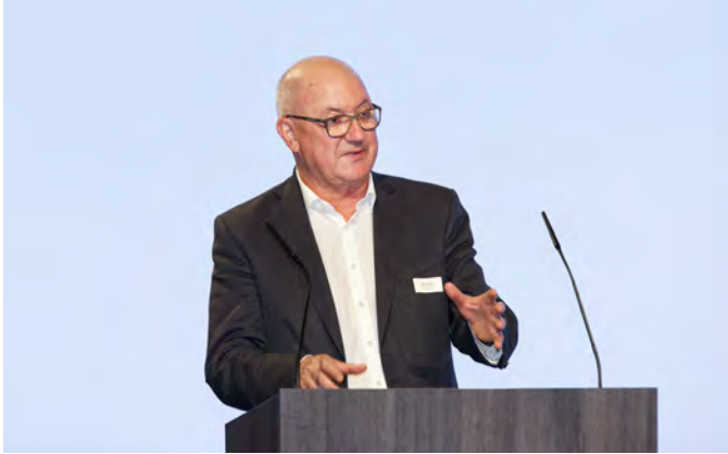
«Wenn man vorwärtskommen will, braucht es Baustellen» – betont Regierungspräsident Isaac Reber in seiner Ansprache.