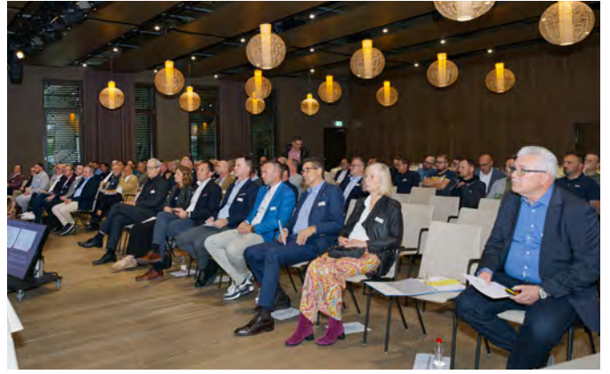
Die Generalversammlung fand im Haus der Wirtschaft in Pratteln statt.